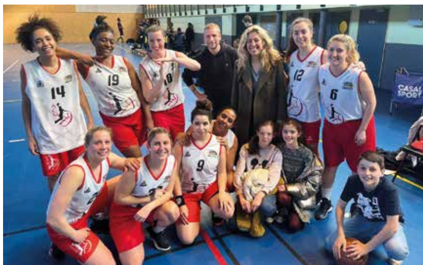
L'équipe senior féminine ambitieuse de monter en division régionale 2.

Le club de basket-ball d'Andrézy-Chanteloup-Maurecourt se prépare pour une saison 2023-2024 pleine de défis et d'ambitions. Cette année, ses deux équipes principales, masculine et féminine, visent la montée dans la ligue supérieure ! Forts d'une première participation sérieuse au meilleur niveau régional la saison précédente, les hommes de l'équipe fanion s'apprentent à retrouver les parquets avec un seul objectif en tête : l'ascension en division nationale 3 ! Si le défi est de taille pour nos joueurs, qui ont réussi à accrocher le maintien dans les derniers mois de compétition, on ne doute pas que la perspective de représenter leur territoire sur la scène nationale saura les galvaniser dans les money-times à venir. La saison promet donc du spectacle où chaque match sera une occasion de prouver force, technique et détermination !