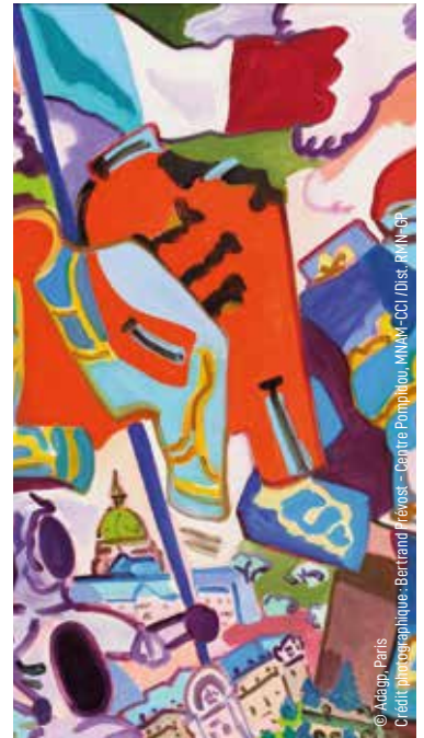
© Adapt. Paris Le fait d'être géographique - Bertrand Frevost - Centre Pompidou, MNM-CCI/Dist. PAM/CPA

Alors que le Centre Georges Pompidou s'engage dans une période de travaux de 5 ans, ses œuvres s'exportent ! Grâce à un partenariat noué avec la Région Île-de-France, Chanteloup-les-Vignes accueille, mercredi 18 octobre au Phénix, la toile « Les Invalides » peinte par l'artiste Charles Lapicque. À partir de 11h et durant toute la journée, l'œuvre originale sera présentée aux visiteurs avec des ateliers de pratique artistique destinés aux enfants. En fin de journée, un conservateur du Centre Pompidou animera une conférence ouverte à tous. Entrée gratuite sur réservation. Pour en savoir plus sur la toile « Les Invalides », rendez-vous sur le site de la Ville.